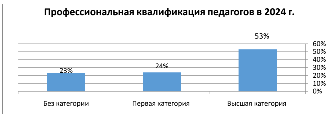
Рисунок 2 - профессиональная квалификация педагогов в 2024г

Ниже на рисунках 2,3 представлена профессиональная квалификация педагогов детского сада №107 «Ягодка» в сравнении с 2024 г.